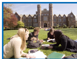
高等院校， 大學和研究機構